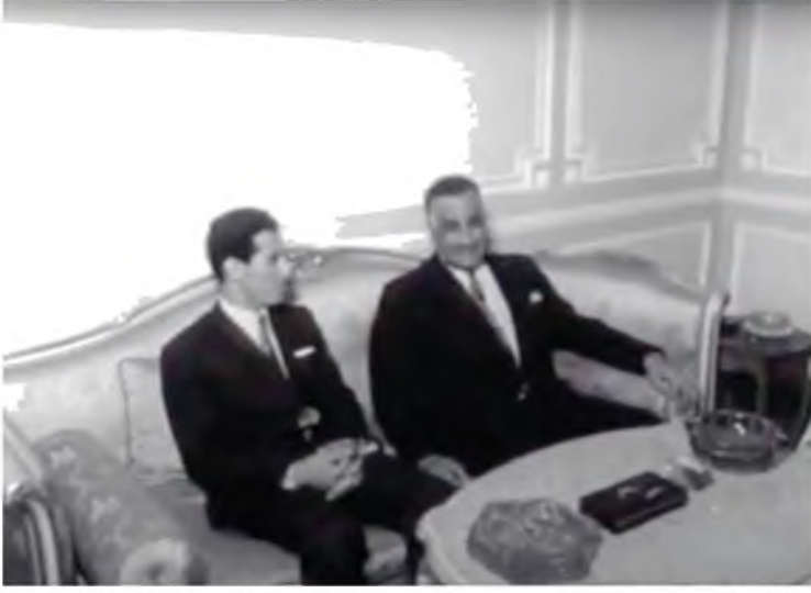
زيارة عبد السلام جلود لمصر ولقاؤه الرئيس جمال عبد الناصر بالقاهرة، 13 / 3 / 1970.